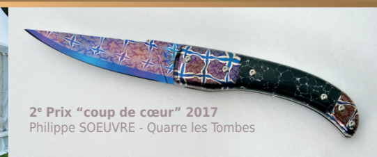
2 e Prix "coup de cœur" 2017 Philippe SOEUVRE - Quarre les Tombes