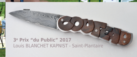
3 e Prix "du Public" 2017 Louis BLANCHET KAPNIST - Saint-Plantaire